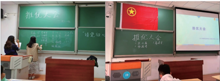
积极开展推优入党工作

班级日常加强思想政治建设,现有正式党员33人,预备党员5人,发展对象17人,积极分子5人,构筑了一支挺膺担当的青年奋进者团队。入学以来,班级坚持开展10余次专题学习会,30余次主题党日、团日活动,进一步坚定“四个自信”,丰富理论基础。