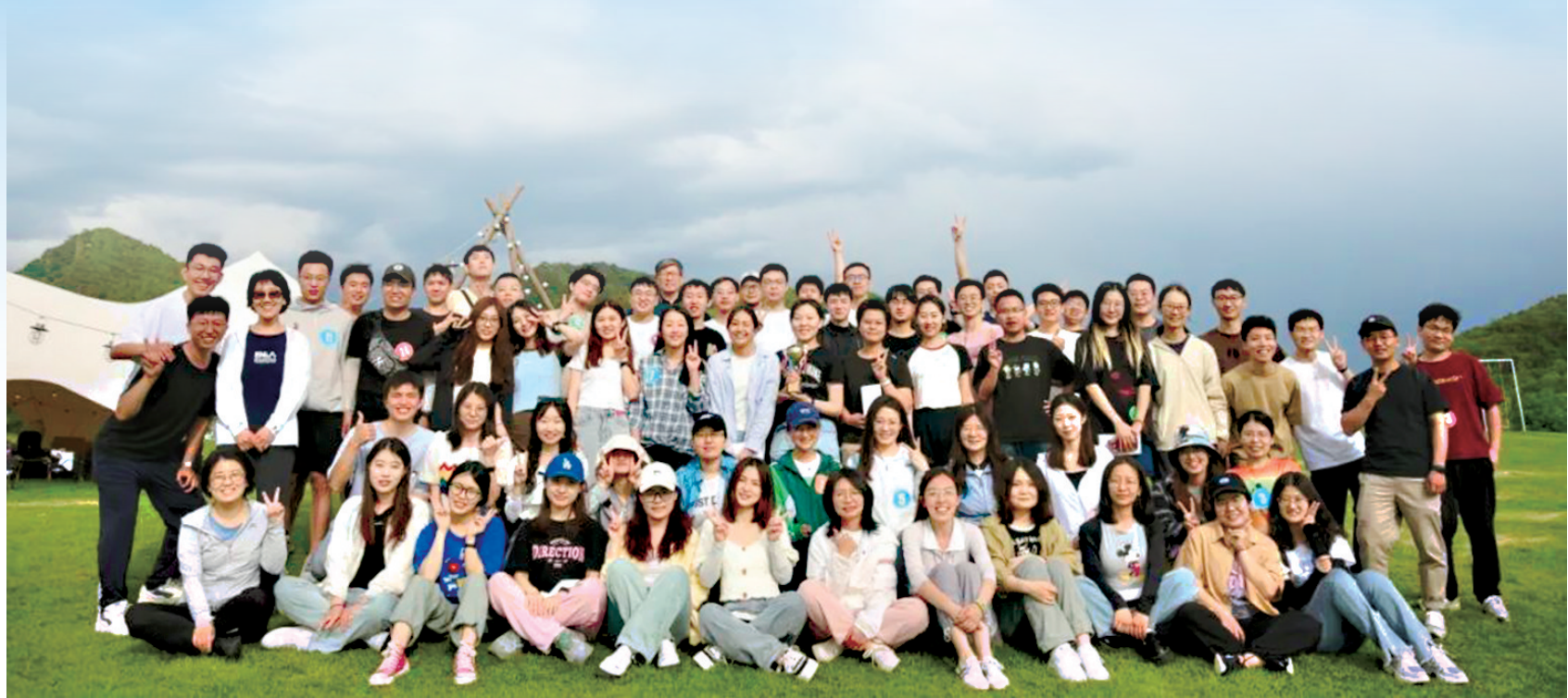
京华山河间,心驻寰宇界;植根首都土,治水任敬业。这个优秀的班集体即将毕业,奔赴属于各自的星辰大海。

在科技竞赛领域,班级成员在“中国研究生双碳大赛”“挑战杯”“互联网+”等多项赛事中都取得了优异成绩,获得国家级二等奖1项、三等奖2项,省部级一等奖1项、二等奖6项、三等奖4项等多项荣誉。同时,班级成员积极在全国有机固废处理与资源利用大会、全国环境化学会、青岛国际水大会等国内多项学术会议上展示学术风采,与优秀学者在交流中碰撞思想火花。